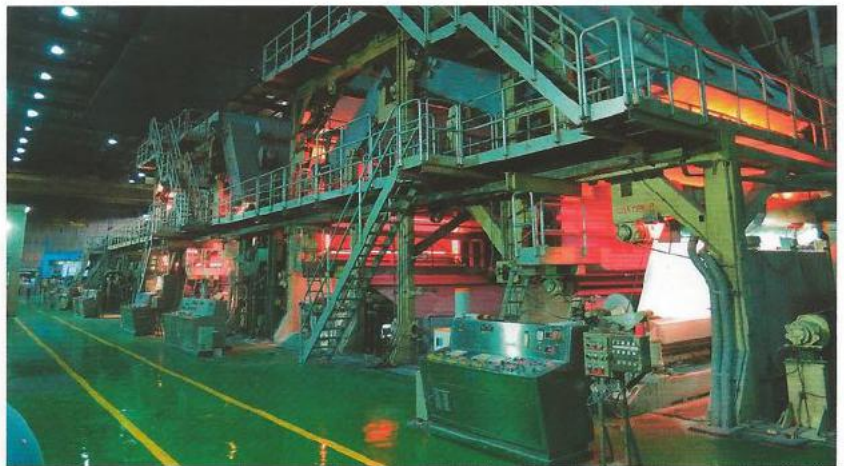
Abb. 2: Compact Engineerings IRE-Strahler am ersten und zweiten Streichkopf im Vordergrund, Impacts TAPS-Strahler noch an dem dritten und vierten Streichkopf des Deckstrichs

Compact verwendet goldbeschichtete Reflektoren, um die gesamte Primärstrahlung in das Papier zu lenken sowie die vom Papier oder Strich reflektierte Sekundärstrahlung wieder auf das Papier zu richten. Das Reflektorkonzept erlaubt auch eine spezielle Luftführung, um sowohl den Reflektor selbst als auch die Lampen kühl zu halten. (Abb. 1)