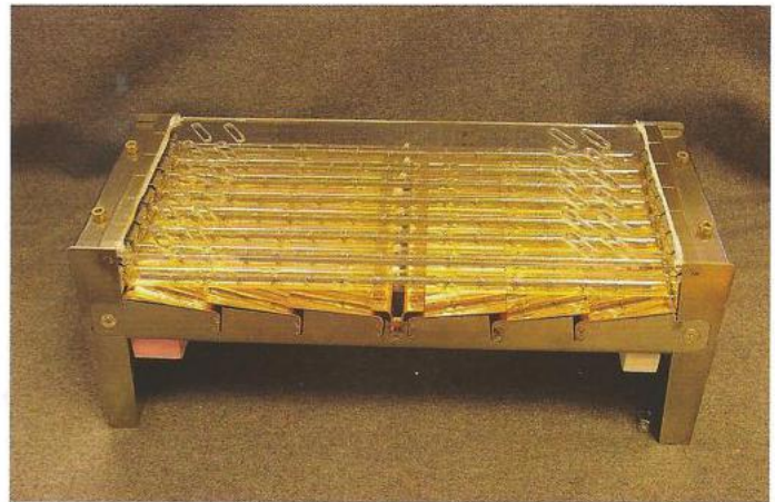
Abb. 1: Compact Engineerings IRE-Strahler mit perforiertem Schutzglas, Goldreflektoren und speziellen Lampen mit hohem Wirkungsgrad

Die PM3 von Ningbo Zhonghua Paper ist eine mehrlagige Langsiebmaschine mit vier Streichköpfen, jeweils zwei für die Oberseite und Rückseite. Die Trocknung erfolgt mit einer Kombination aus elektrisch betriebenen kurzwelligen Infrarotstrahlern mit nachfolgenden Heißluftstrahlern. Dabei werden die Heißlufttrockner mit Temperaturen von 168 °C und 174 °C betrieben.